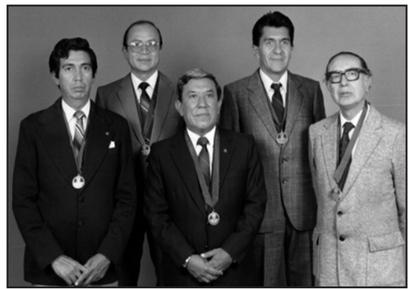
Decano del Consejo Regional V, Colegio Médico del Perú, 1984-1986