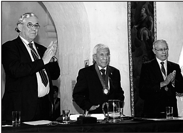
Incorporación como Académico de Número, 2014