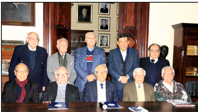
Tertuliente con académicos asistentes.