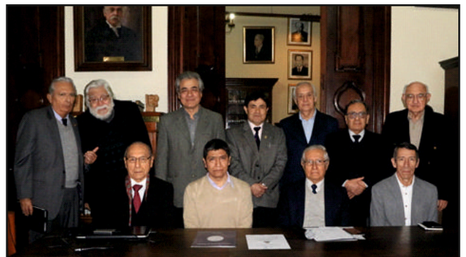
Tertuliente con académicos asistentes.