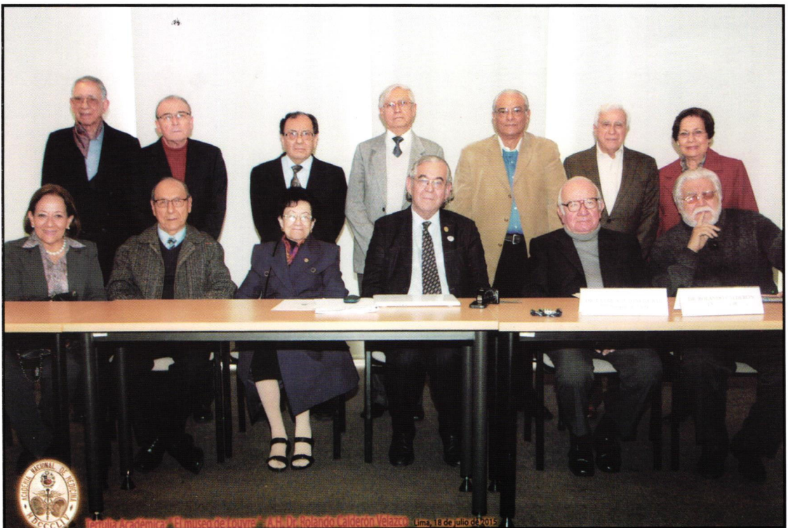
Académicos e invitados.