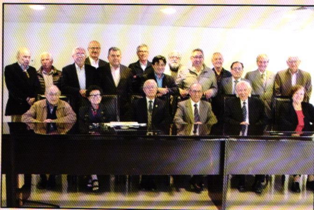
Asistentes a la Tertulia