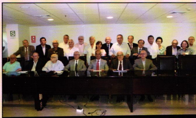
Asistentes a la Tertulia