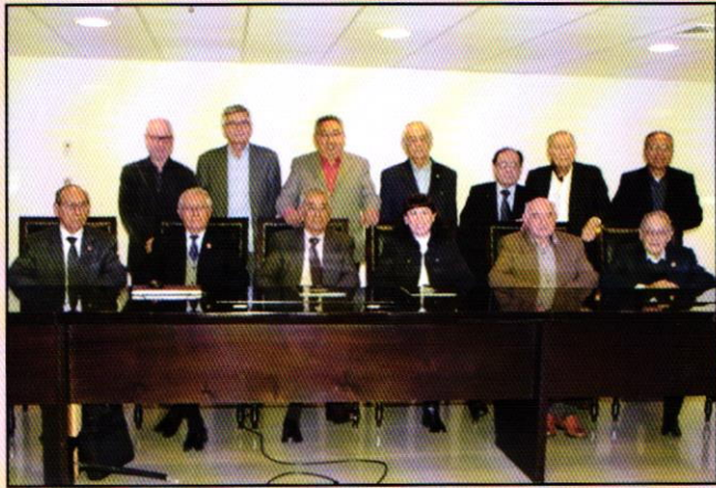
Asistentes a la Tertulia