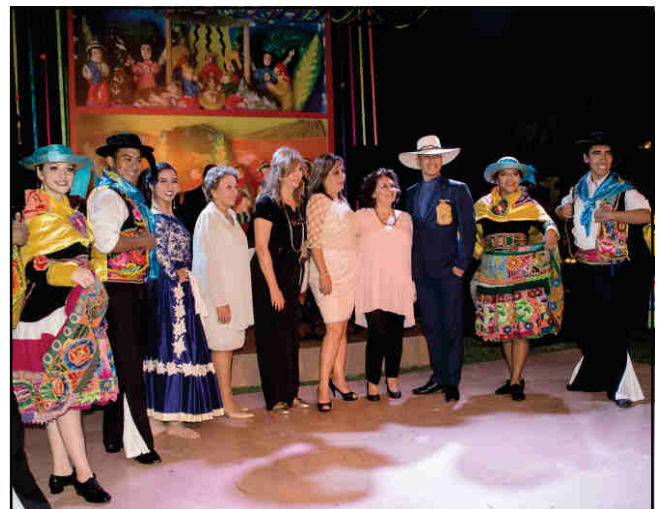
El Comité de Damas y el elenco de artistas invitados