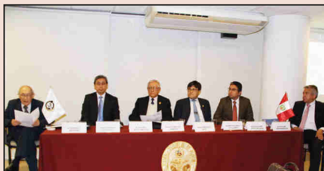
El Presidente de la ANM con los expositores del simposio.