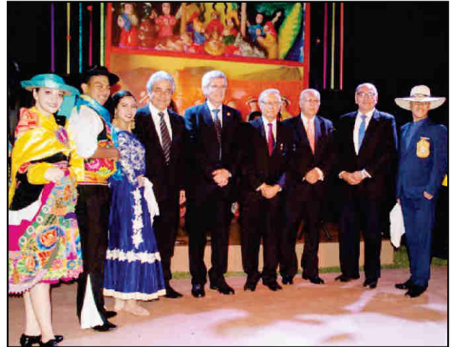
El presidente de la ANM con la Junta Directiva y el elenco de artistas invitados

Con motivo de celebrar las Fiestas de Navidad y Año Nuevo el Comité de Damas realizó su tradicional cena navideña el sábado 02 de diciembre, a las 7:30 p.m., en Santiago de Surco con una nutrida concurrencia que además disfrutó la presentación del Grupo Folclórico Todas Las Sangres